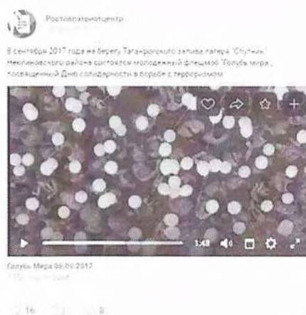
Рисунок 8 – Информация о прошедшем мероприятии в социальной сети «ВКонтакте»

Видеоматериал как один из результатов состоявшейся акции был распространен через отдельную публикацию (см. рисунок 8).