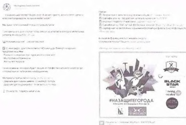
Рисунок 1 – Анонс мероприятия в социальной сети

В анонсе должна содержаться информация, разъясняющая что, где, когда и кем проводится. Данные могут предоставляться дозированно, обязательный элемент – наличие прямых контактов организаторов (см. рисунок 1).