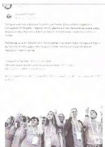
Рисунок 7 – Информация о проходящем мероприятии в социальной сети «ВКонтакте»

Видеоматериал как один из результатов состоявшейся акции был распространен через отдельную публикацию (см. рисунок 8).