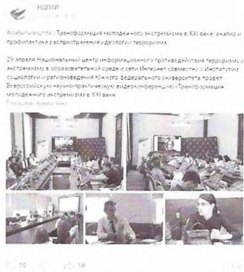
Рисунок 12 – Информация о прошедшем мероприятии