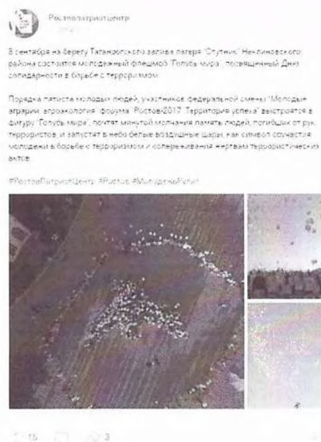
Рисунок 6 – Информация о предстоящем мероприятии в социальной сети «ВКонтакте»

Иллюстративным примером можно привести акцию памяти «Голубь мира», проведенную Ростовпатриотцентром в 2017 году. В сети Интернет была размещена анонсирующая информация (см. рисунок 6).