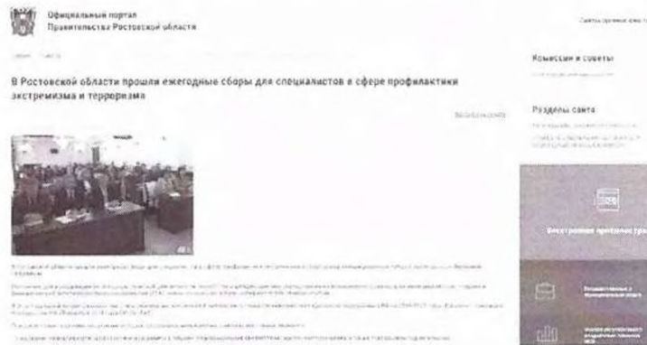
Рисунок 10 – Информация о прошедшем мероприятии

Иллюстрацией информационного освещения мероприятий такого рода является проведение ежегодных сборов для специалистов, организованных Антитеррористической комиссией Ростовской области. В новостной публикации сообщается, что ключевой темой встречи было обсуждение принятого Комплексного плана–2023, также в программу сборов входили лекции представителей силовых ведомств, регионального министерства образования и департамента потребительского рынка (см. рисунок 10).