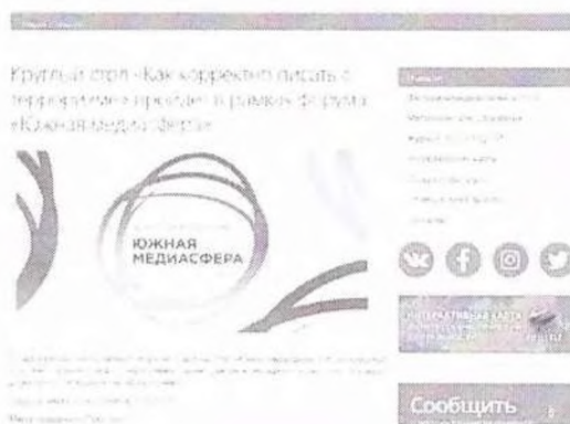
Рисунок 9 – Информация о предстоящем мероприятии

Данный пункт можно проиллюстрировать мероприятием – Круглый стол «Как корректно писать о терроризме», который прошел в рамках форума «Южная медиасфера» (см рисунок 9).