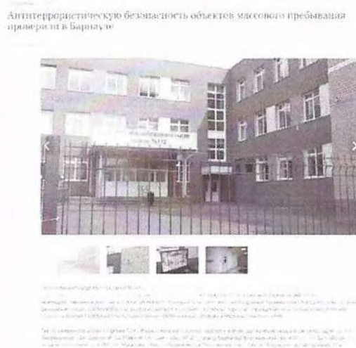
Рисунок 11– Информация о прошедшем мероприятии

Другой пример – мероприятие по мониторингу обеспечения антитеррористической безопасности объектов массового пребывания в г. Барнаул (см. рисунок 11).